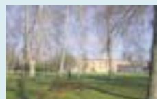
Paseo Los Llanos

Espacio de Prácticas Espirituales Matutinas (Paseo de los Llanos). Comenzamos juntos, en unión y de forma interiorizada, la larga jornada de mutuo compartir que nos aguarda. Cada día una comunidad espiritual o religiosa conducirá este espacio de una forma participativa y universal. Habrá también opción para desarrollar prácticas de orden físico.